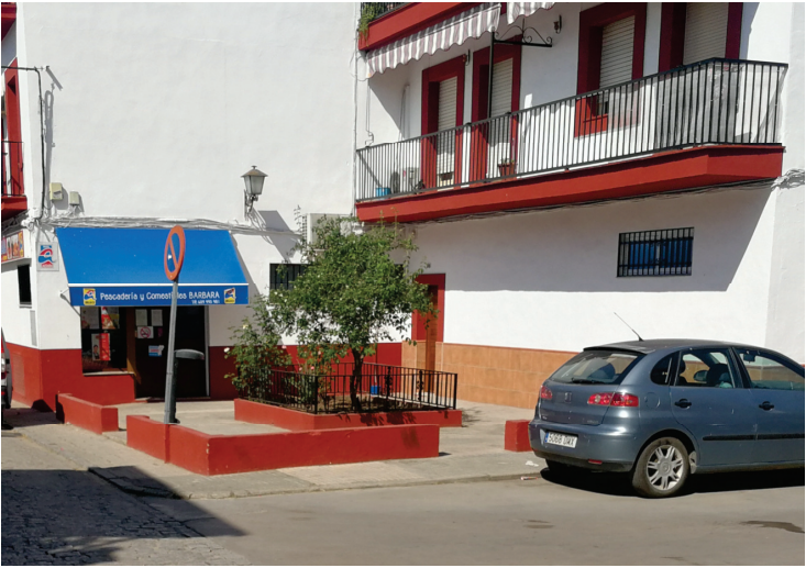
Estado actual de la zona abierta de la que es necesario disponer para ejecutar la actuación proyectada.

La actuación proyectada consiste en demoler la pavimentación existente y el pretil de baja altura, para ubicar en dicho espacio abierto un parterre en la zona central coplanario con la pavimentación de piedra natural, además de preveer la plantación de tres arboles de hoja perenne con cubrealcorques y la instalación de dos bancos y una papelera.