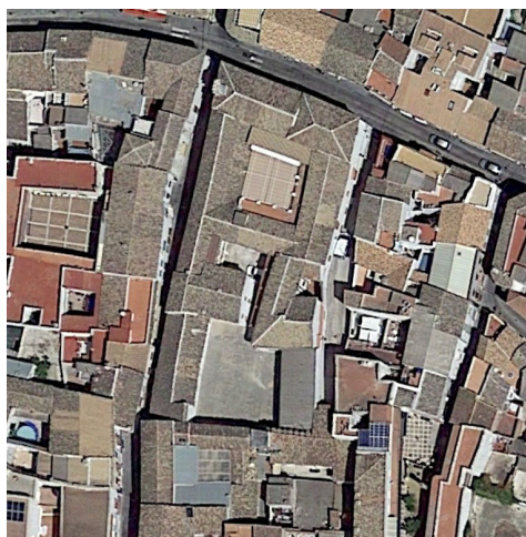
Fotografía aérea actual del inmueble.

El cambio se invoca por parte de la congregación religiosa “Hijas del Patrocinio de María” como propietaria del inmueble en cuestión, mediante escrito presentado ante el Ayuntamiento de Baena con fecha de 29 de Octubre de 2.018, en el que se señala que una vez comprobada la información contenida en la planimetría del vigente PGOU de Baena se que parte de las instalaciones y propiedad del colegio en cuestión como parte de la Red Viaria del municipio, solicitándose la modificación de dicha circunstancia.