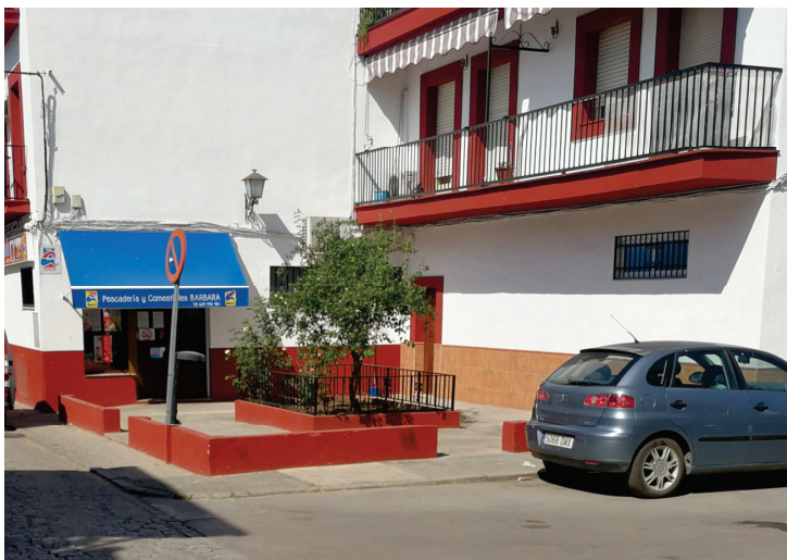
Estado actual de la zona abierta de la que es necesario disponer para ejecutar la actuación proyectada.

La actuación proyectada consiste en demoler la pavimentación existente y el pretil de baja altura, para ubicar en dicho espacio abierto un parterre en la zona central coplanario con la pavimentación de piedra natural, además de preveer la plantación de tres arboles de hoja perenne con cubrealcorques y la instalación de dos bancos y una papelera.