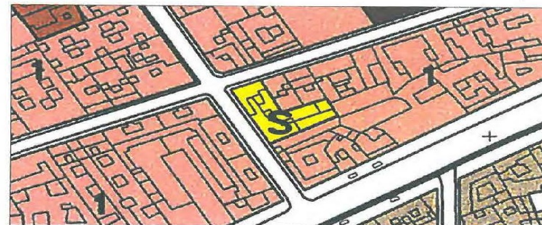
Recorte de la hoja nº 26 del plano de "Calificación, Usos y Sistemas" del PGOU vigente.

El objeto o finalidad del Plan es adecuar a la realidad existente, por medio del correspondiente procedimiento de innovación del vigente Plan General de Ordenación Urbanística de Córdoba, el destino urbanístico previsto en la ordenación pormenorizada establecida por dicho Plan sobre los terrenos de la parte de la catastral 3552809UG4935S destinada a EQ-SIPS, por establecer para los mismos una calificación urbanística discordante con el uso dominante de la edificación construida en 1970; residencial plurifamiliar, puesto que se construyó un edificio comercial y de viviendas en los nums. 2 y 4 de la Calle Doce de Octubre.