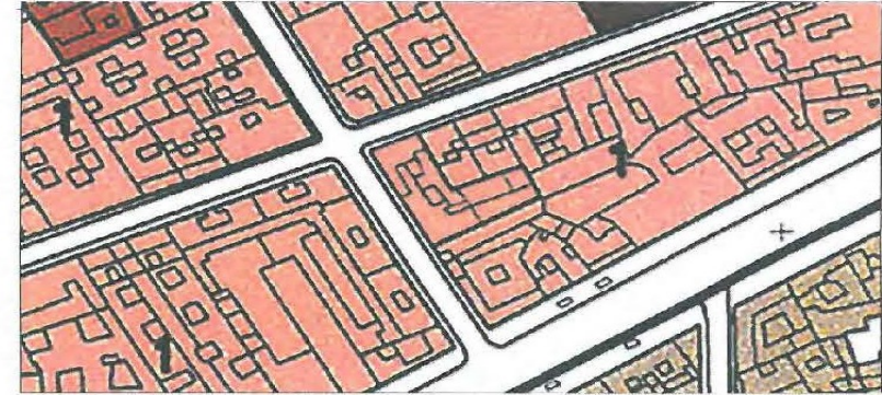
Recorte de la hoja nº 26 del plano de "Calificación, Usos y Sistemas" del PGOU. Ordenación modificada.

La ordenación resultante del presente proceso de innovación del PGOU se define por medio de las siguientes determinaciones: adscripción de los terrenos a la subzona 1 de la zona de ordenación en Manzana Cerrada (MC-1), del suelo urbano consolidado que ocupa parte de la parcela con referencia catastral 3552809UG4935S.